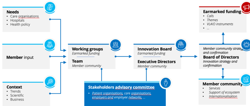
Schema bestuur MEDVIA

het HealthTech innovatielandschap van Vlaanderen alsook de strategische werking en uitbouw van de service toolbox van MEDVIA.