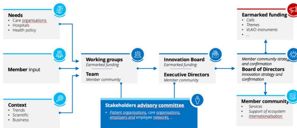
Schema bestuur MEDVIA